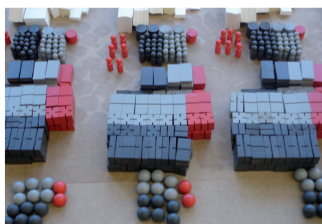
Produktion des 3D-Materials

Unternehmenssimulationen und Planspiele sind Methoden, die Schritt für Schritt Einblicke in ein Problem und Erkenntnisse zur Lösungsfindung geben. Diese Methoden sollen auch anwendbar sein, um eine breite Palette realer Aufgaben prototypisch anzugehen. Dabei entsteht Wissen, das sich systematisch zu erfassen lohnt. Das Projekt «Company in Action» will bestehende – spezifische – Planspiele gestalterisch und mit Konzepten der visuellen Kommunikation explorieren und ein neues, noch nicht existierendes flexibles Management-Tool für den systematischen Wissenstransfer und das «Rapid Prototyping» von Entwicklungs- und Arbeitsprozessen in der Wirtschaft und der Verwaltung erstellen und testen.