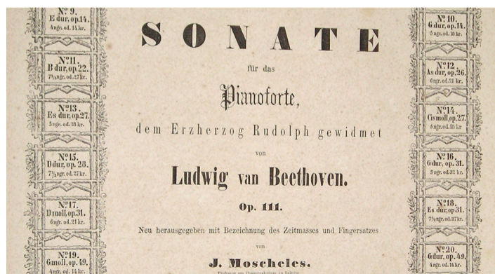
In Moscheles' verschiedenen Ausgaben spiegelt sich auch die Entwicklung von Klavierbau, sozialen Voraussetzungen und pianistischer Technik. Deutsche Ausgabe bei Hallberger, c. 1857, Frontispiz.