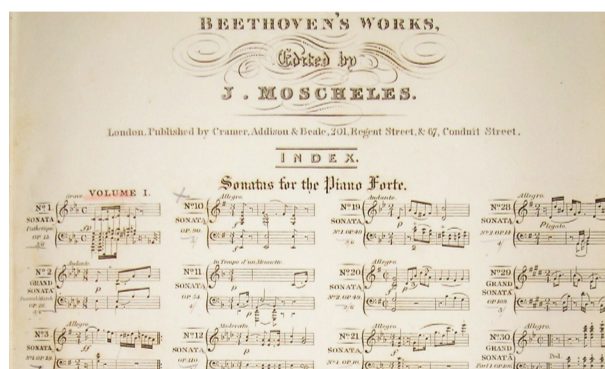
Beethoven-Schüler Ignaz Moscheles prägte mit seinen Editionen das Bild der Nachwelt auf seinen Lehrer ganz entscheidend. Englische Ausgabe bei Cramer, c. 1837, Inhaltsverzeichnis.