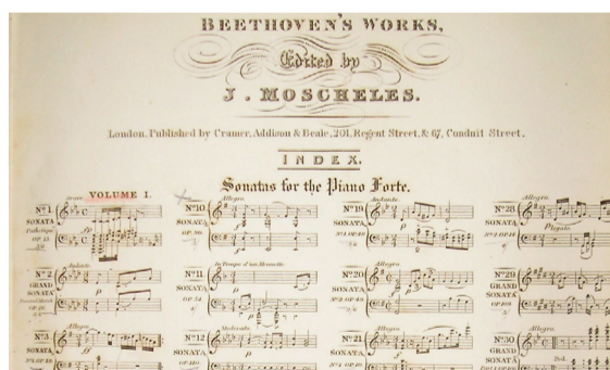
Beethoven-Schüler Ignaz Moscheles prägte mit seinen Editionen das Bild der Nachwelt auf seinen Lehrer ganz entscheidend. Englische Ausgabe bei Cramer, c. 1837, Inhaltsverzeichnis.