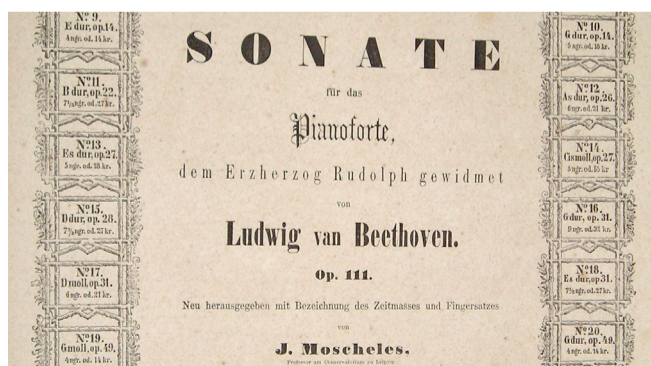
In Moscheles' verschiedenen Ausgaben spiegelt sich auch die Entwicklung von Klavierbau, sozialen Voraussetzungen und pianistischer Technik. Deutsche Ausgabe bei Hallberger, c. 1857, Frontispiz.

Projektleitung: Mitarbeit: Partner: Laufzeit: Finanzierung: Kontakt: