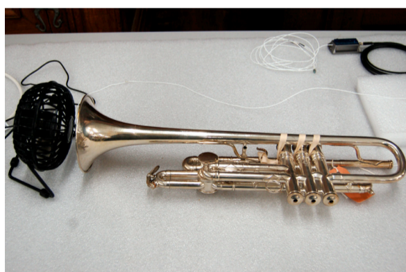
Gesucht werden Methoden zur Vermeidung von Korrosion im Innern der Messinginstrumente. Stellt ein Ventilator die Lösung dar, wie die Instrumente genügend ausgetrocknet werden können?