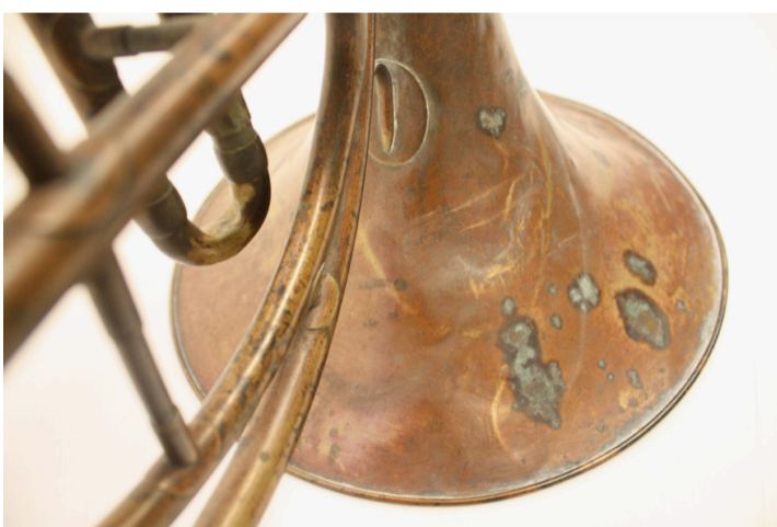
Messing korrodiert von aussen und innen, besonders aufgrund der im Instrument verbleibenden Feuchtigkeit und der Salze im Speichel.

Aufbauend auf den Erkenntnissen über innere Korrosion und deren Entwicklung werden Methoden präventiver Konservierung für gespielte historische Messinginstrumente evaluiert, die sowohl für MusikerInnen als auch für Museen von Nutzen sind. Deren Umsetzung wird im Rahmen einer historisch informierten Aufführung von Strawinskys Sacre du Printemps exemplifiziert. Die benötigten 22 historischen Blechblasinstrumente werden gemäss der entwickelten Protokolle präventiver Konservierung behandelt. Um die damals benutzten Modelle zu identifizieren und damit die Klanglichkeit des Orchesters rekonstruieren zu können, gehen musikhistorische Forschungen den Musikern der Uraufführung nach. Zudem wird eine Datenbank entwickelt, wie solcherart gewonnene Erkenntnisse zu den Spieleigenschaften der Instrumente und zu passenden Mundstücken erfasst und weitervermittelt werden können. Dies soll aufzeigen, ob und gegebenenfalls wie das Dilemma für historische Blechblasinstrumente allenfalls doch gelöst werden könnte: «to play and to display»?