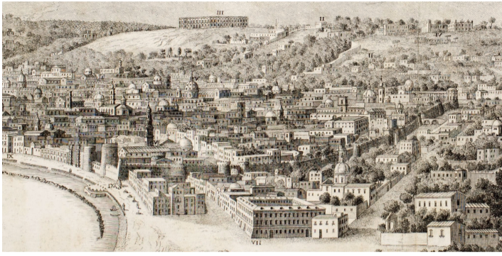
Ansicht von Neapel. Ausschnitt von tavola 26 des Stadtplanes des Herzogs von Noja (Giovanni Carafa), 1775.