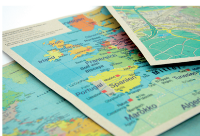
Geografische Karten (Teil der «Cultural Probes»): BewohnerInnen werden zu ihrem persönlichen und kulturellen Hintergrund befragt.

Einführung Die Studie untersuchte am Beispiel des GZ Gäbelbach wie Quartierbewohner/-innen die bestehenden Kommunikationsmassnahmen wahrnehmen. Hierbei war es von besonderem Interesse, ob es kulturspezifische Unterschiede bei der Wahrnehmung von Bildern und Schrift gibt. Somit sollten neue Grundlagen zu den Möglichkeiten der visuellen Kommunikation im Bereich der Integration geschaffen werden. Unter Berücksichtigung der Erkenntnisse könnten wesentliche Impulse zur Verbesserung des visuellen kommunikativen Umfelds im gesamten Arbeitsbereich gegeben werden.