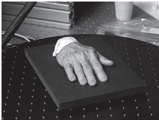
// Moulage beim Scannen: Eine Versuchs-Moulage auf dem Drehteller des 3D-Scanners im Institut für Drucktechnologie der BFH-TI.