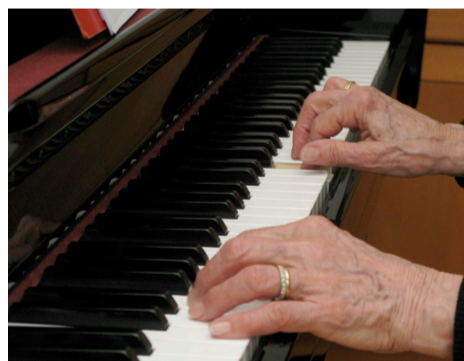
Es geht vorwärts: mit beiden Händen.