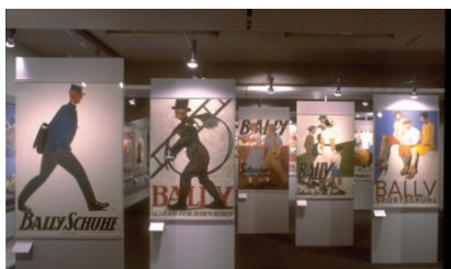
Emil Cardinaux 1877–1936 (Museum für Gestaltung Zürich, Galerie, 1985). Die Einzelausstellung dokumentiert das Werk des bedeutenden Schweizer Plakatkünstlers anhand seiner erfolgreichsten Artefakte.

This project investigates the forms of representation of Swiss graphic design history in publications and exhibitions. Linguistic content, the choice of artefacts, their arrangement and book and exhibition design serve to construct historic realities that influence the perception of history. The most important publications and exhibitions will be shown in context for the first-ever time. It is expected that the analysis of content and the design of “historic design sources” will form a new basis for scholarly investigations into the history of graphic design in Switzerland.